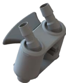
Quick disconnect system without water loss Sistema di sgancio dei tubi senza perdite di acqua