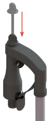
Self priming system Innesco rapido