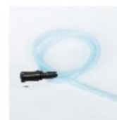
Hadička pro přisávání vzduchu