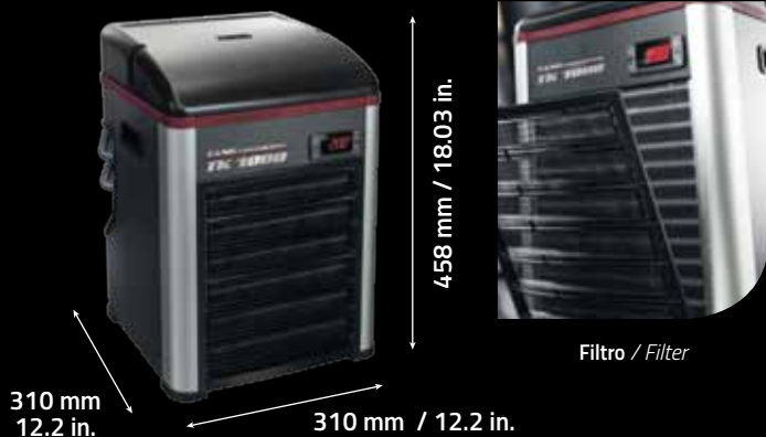
Filtro / Filter