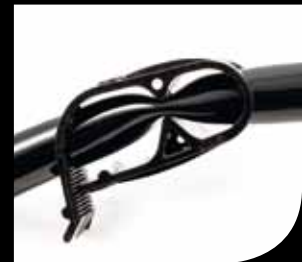
Pinza schiaccia tubo "Squeeze tube clamp"